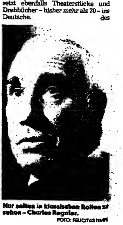
Nur selten in klassischen Rollen zu sehen - Charles Regnier.

Der kühle Kommissar. Charles Regnier, der grau melierte Boulevard-Komödien, der finstere Film-Börsenwicht des deutschen Films, der kühle Kommissar aus der 13teiligen Fernsehserie „Mordkommission“ wird 70 Jahre alt. Seit mehr als 40 Jahren steht Regnier auf der Bühne.